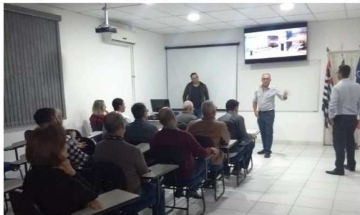
Imagem da palestra